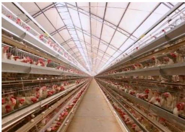
Figura 9: Sistema automatizado piramidal Figura 10: Detalhe do piso do sistema piramidal (vista por baixo)

O sistema piramidal assegura a ventilação e iluminação em todos os níveis, como o sistema vertical é totalmente automatizado e possui cavaletes de sustentação industrializados em aço galvanizado, detalhe na Figura 9, proporciona o alinhamento das gaiolas.