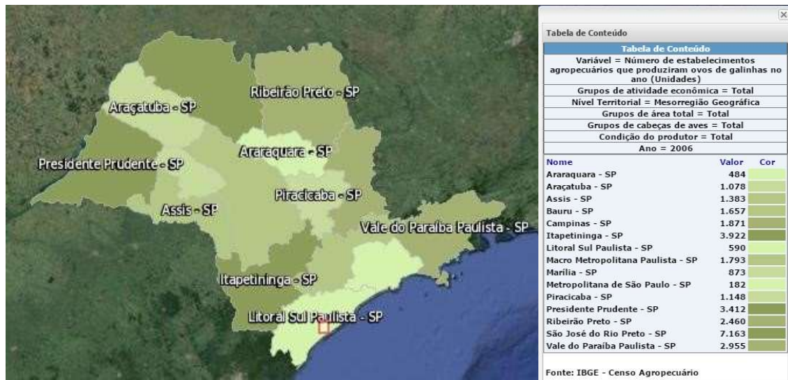
Figura 1: Cartograma do número de produtores de ovos no Estado de São Paulo