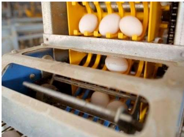
Figura 7: Recolhedor automatizado de ovos