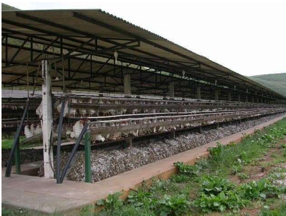
Figura 1: Instalação convencional com depósito de dejetos acumulados poedeiras