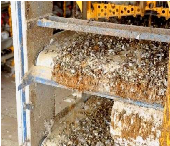
Figura 5: Transportador de cinta vertical automatizado de dejetos (detalhe do raspador)