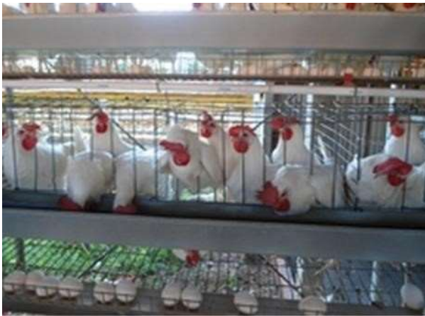
Figura 3: Instalação convencional com das criadeiras e da coleta de ovos Figura 4: Visão geral de uma instalação detalhe convencional para poedeiras